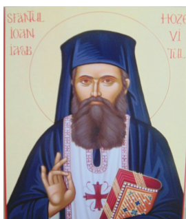
Sfântul Ioan Iacob de la Neamt (Hozevitul)