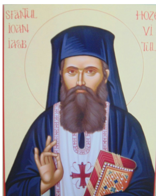
Sfantul Ioan Iacob de la Neamt (Hozevitul)