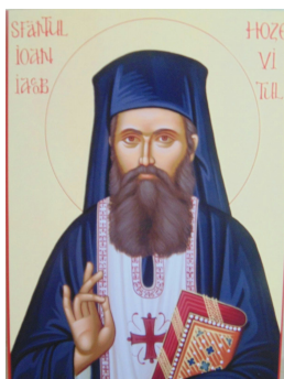
Sfântul Ioan Iacob de la Neamț (Hozevitul)

Let thy mind fast from vain thoughts; let thy memory fast from remembering evil; let thy will fast from evil desire; let thine eyes fast from bad sights: turn away thine eyes that thou mayest not see vanity; let thine ears fast from vile songs and slanderous whispers; let thy tongue fast from slander, condemnation, blasphemy, falsehood, deception, foul language and every idle and rotten word; let thy hands fast from killing and from stealing another's goods; let thy legs fast from going to evil deeds: Turn away from evil, and do good. Saint Tichon of Zadonsk